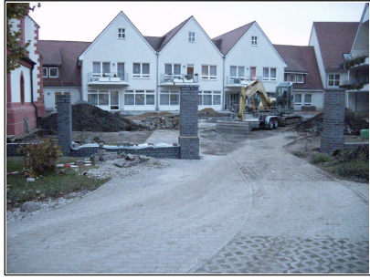
Hochbau- (Pfeiler) und Tiefbau-/Landschaftsbauarbeiten parallel auf der Baustelle