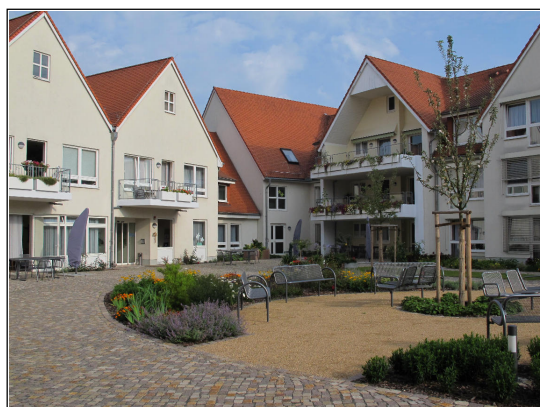
Rondell unter dem Apfelbaum