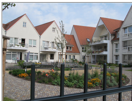
Blick von außen in den „Garte der Sinne“