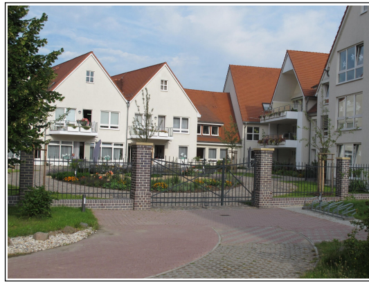
Tor-/Zaun von außen