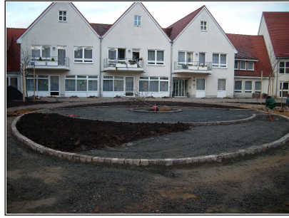
Vorbereitung der Pflanzfläche im Rondell; rechts der Schotterunterbau für die Feuerwehrezufahrt; Bodenschicht 10cm