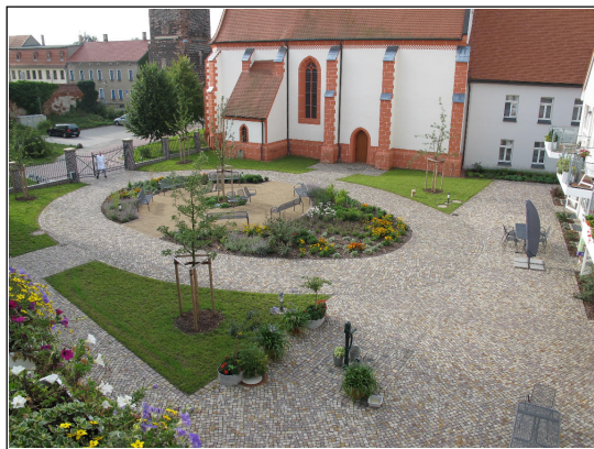
Gesamtanlage „Garten der Sinne“