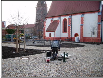
Installation der Pumpe