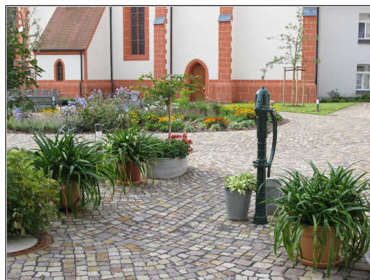
„Garten der Sinne“ – die Handpumpe