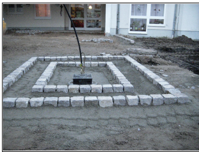
Einfassung der Pflasterfläche an der Pumpe