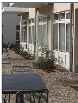
Die Küchenbeete und Bestuhlung auf der Terrasse