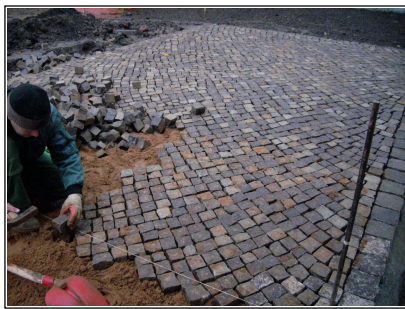
Dornreichenbacher Quarzporphyr 6/8er